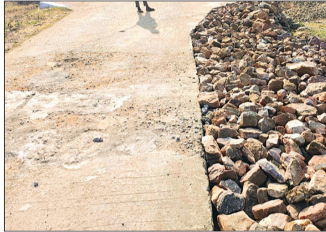
किनारे लगा दिए गए और पिलरों पर रंग-रोगन कर इतिश्री